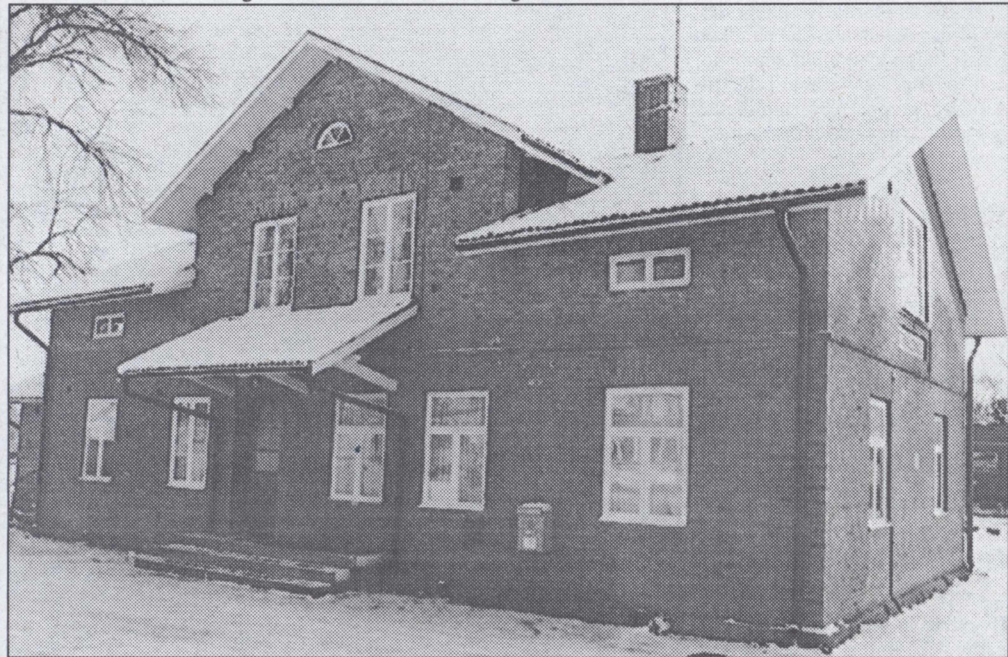
I Strålsnäs nedlagda SJ-station är det tänkt att den nya fritidsgården ska ligga. Dock är det en del reparationsarbete som ska till innan lokalerna duger.