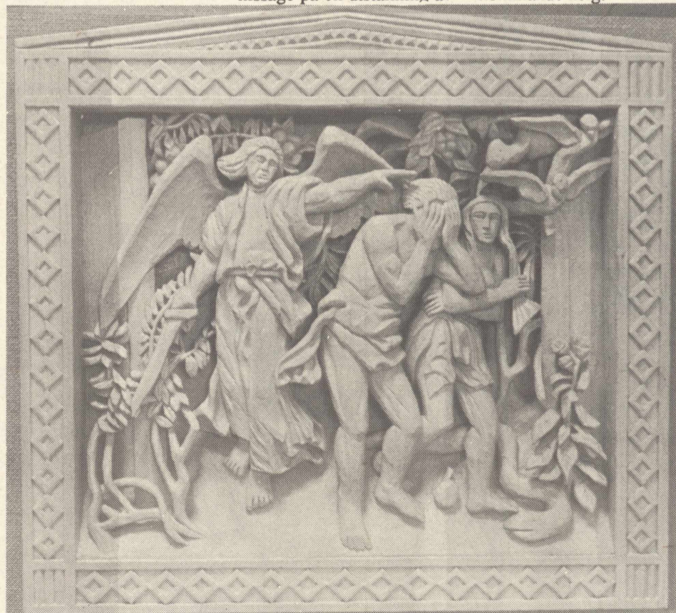
Träsnideri av Bernt Dahlqvist.

Utställningen pågår t.o.m. kommande helg.