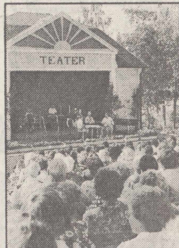
En efterlängtat vy för många. Fullspikat framför teaterladans scen när den första upplagan av Stenbocksdagen firades på måndagen.