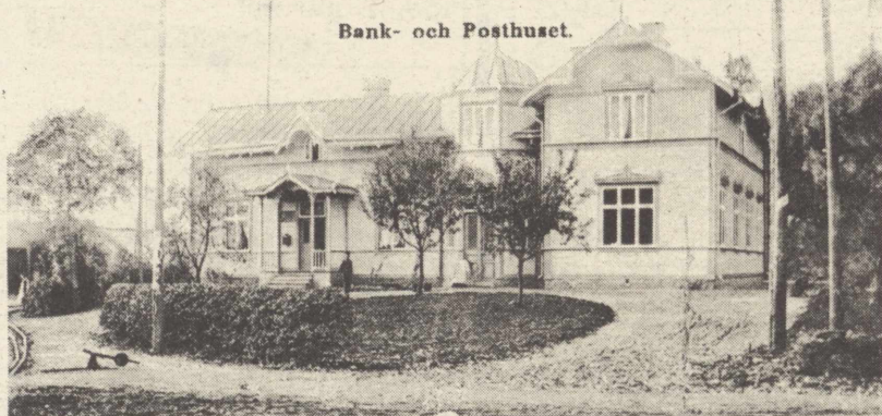
Bank- och Posthuset.