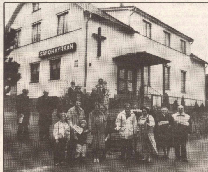
Varsågod! Några av Saronkyrkans medlemmar är här på väg att dela ut denna tidning till dig.

Även under veckorna inbjuds till samlingar av olika slag.