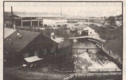
Boxholms gamla bruk finns inte längre kvar som "storbruk" utan har delats upp i flera mindre enheter. Men brukstanken och lite av den gamla andan lever dock kvar.

Boxholms samhälle med 4 000 invånare utgör centralort. Övriga tätorter är Malexander, Ekeby och Rinna. För att klara av den ökande inflyttningen byggs bostäder på flera håll och ännu flera planeras inom den närmaste framtiden.