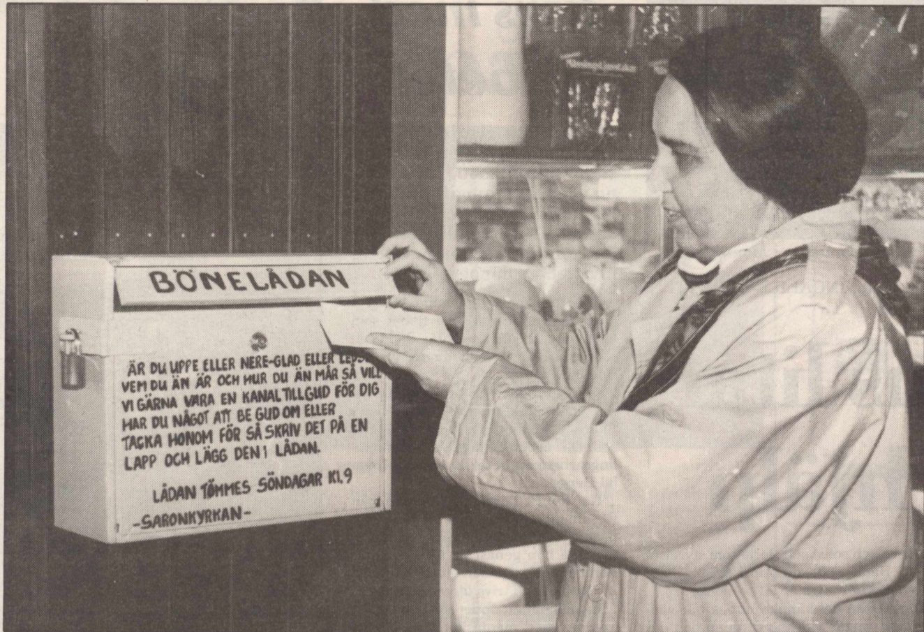
Ett brev läggs i den ovanliga och förmodligen enda bönebrevlådan i Östergötland. Den finns i Boxholm och vem som vill kan där tala om sina bekymmer utan att någon får reda på vem som lagt i brevet.