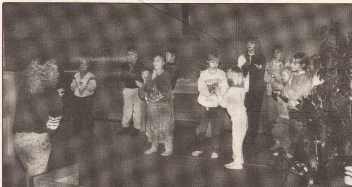
Sång och musik intresserar de flesta och har sin givna plats även bland de unga.