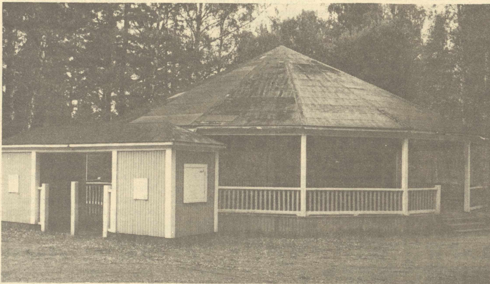
LO-sektionen i Boxholm ser gärna att man inom kommunen tar upp en diskussion om folkparkens framtid.