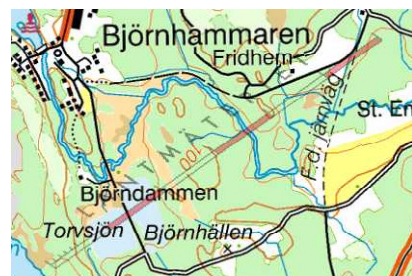
Björnhällan (eller Björnhälla) i Närke nära Östgötagränsen tycks vara borta. Torpet brukades av mormors morfar, plus dennes far.

Funderar du på att släktforska så tycker jag absolut du ska börja. Det går ju alltid att börja lite försiktigt.