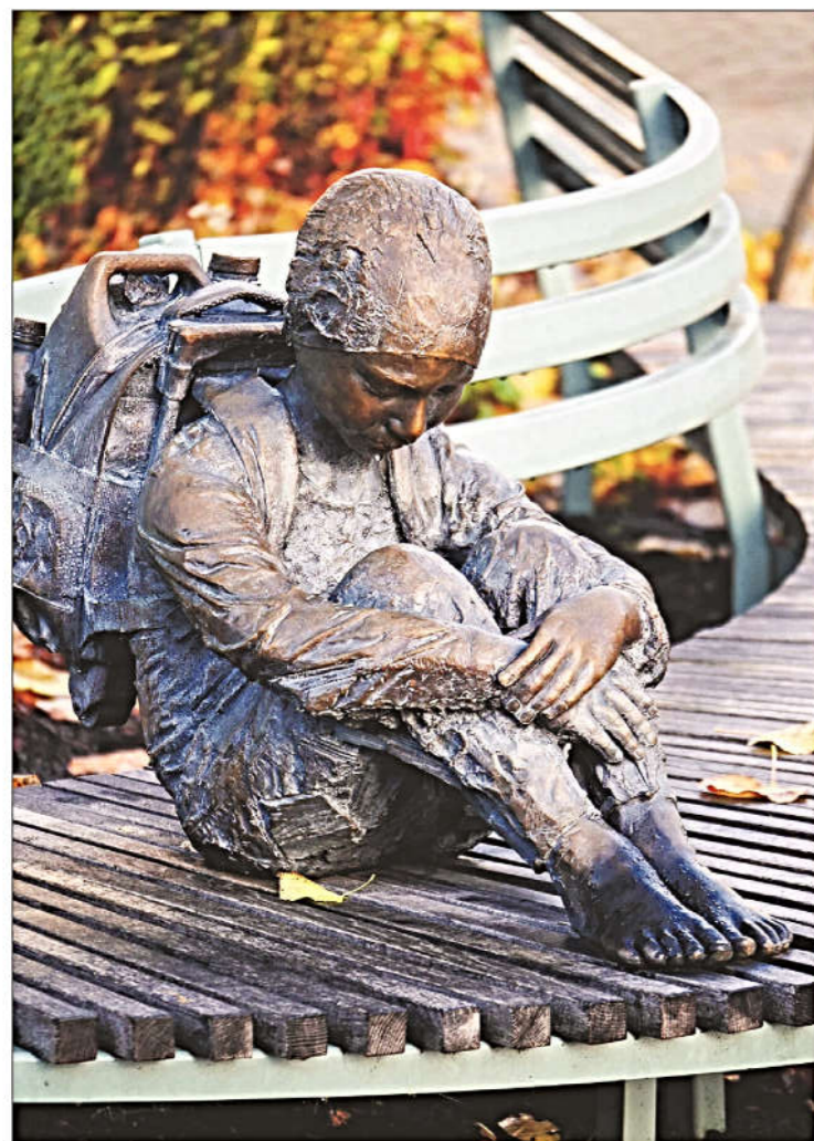
Det finns många detaljer att ta del av när man promenerar i Varberg.