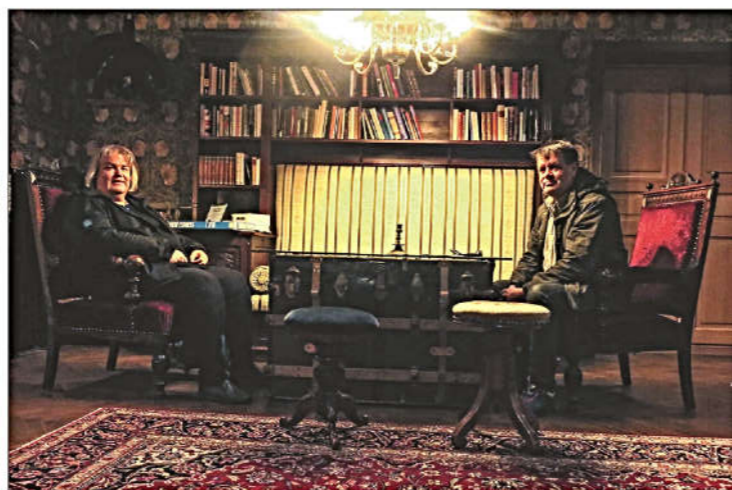
Hotell Gästis är ett väldigt annorlunda hotell. Antika möbler, bokhyllor och tavlor ger en hemtrevlig atmosfär. Och böcker kan lånas hur mycket man vill.