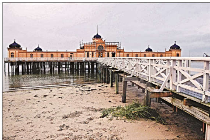
Det äldsta kallbadhuset i Varberg uppfördes 1866. Den nuvarande byggnaden är från 1903.