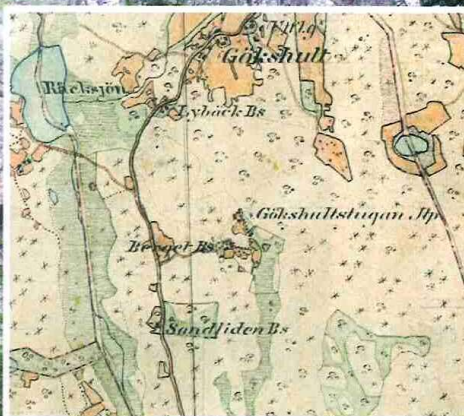
På den gamla häradskartan från 1870-talet finns både Gökshultstugan och Herkonastugan redovisade. Fast på denna karta kallas Herkonastugan för Bergtet.