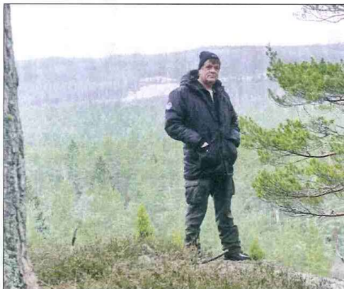
De som vågar sig upp på höjderna bjuds på en vidunderlig utsikt över Malexanderskogarna. Nog borde man kunna slå ihjäl sig om man ramlar ner från detta berg...